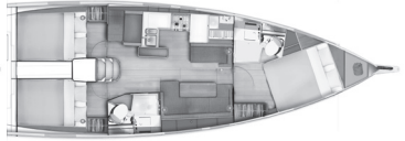
Version A Cabine propriétaire avant, 1 cabine arrière / 1 salle d'eau (Meuble dressing + lavabo privatif en cabine avant, en option)